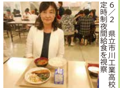
6/2 定時制夜間給食を視察 県立市川工業高校