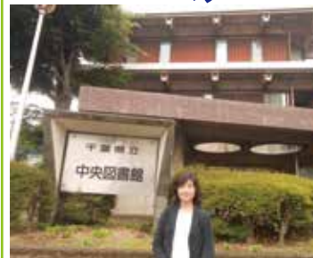
6/13 聞き取り 県立中央図書館で