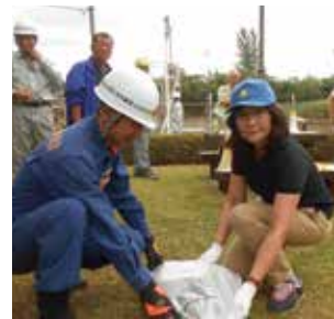
6/11 土のう作り 高崎川水防訓練で