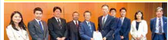
3/13 「Society5.0の社会実装に向けた千葉県への会派政策提言」を知事に提出