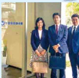
3/23 千葉県医師会訪問 感染症の専門家に聞く

今年1月末から新型コロナウイルスが感染拡大。3月末には東部の障害者施設で集団感染が発生するなど、県は対応に追われていました。