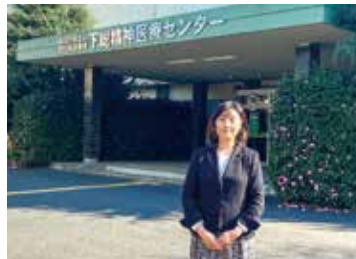
3/12 下総精神医療センター視察