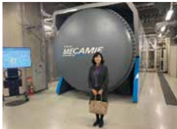
2/14月 大手町丸の内有楽町地区 スマートシティ視察