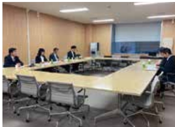
1/27 都庁の業務改革(ICT・テレワーク) 防災・教育等の間取り