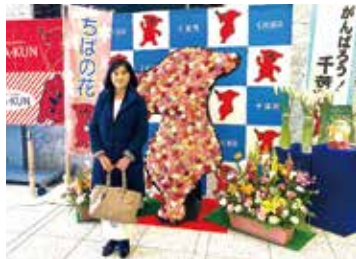
3/12 ちばの花をアピール