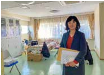
1/9 君津特別支援学校分教室 児童心理治療施設「望みの門」