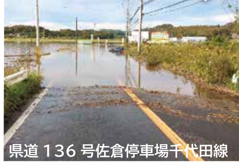
県道136号佐倉停車場千代田線